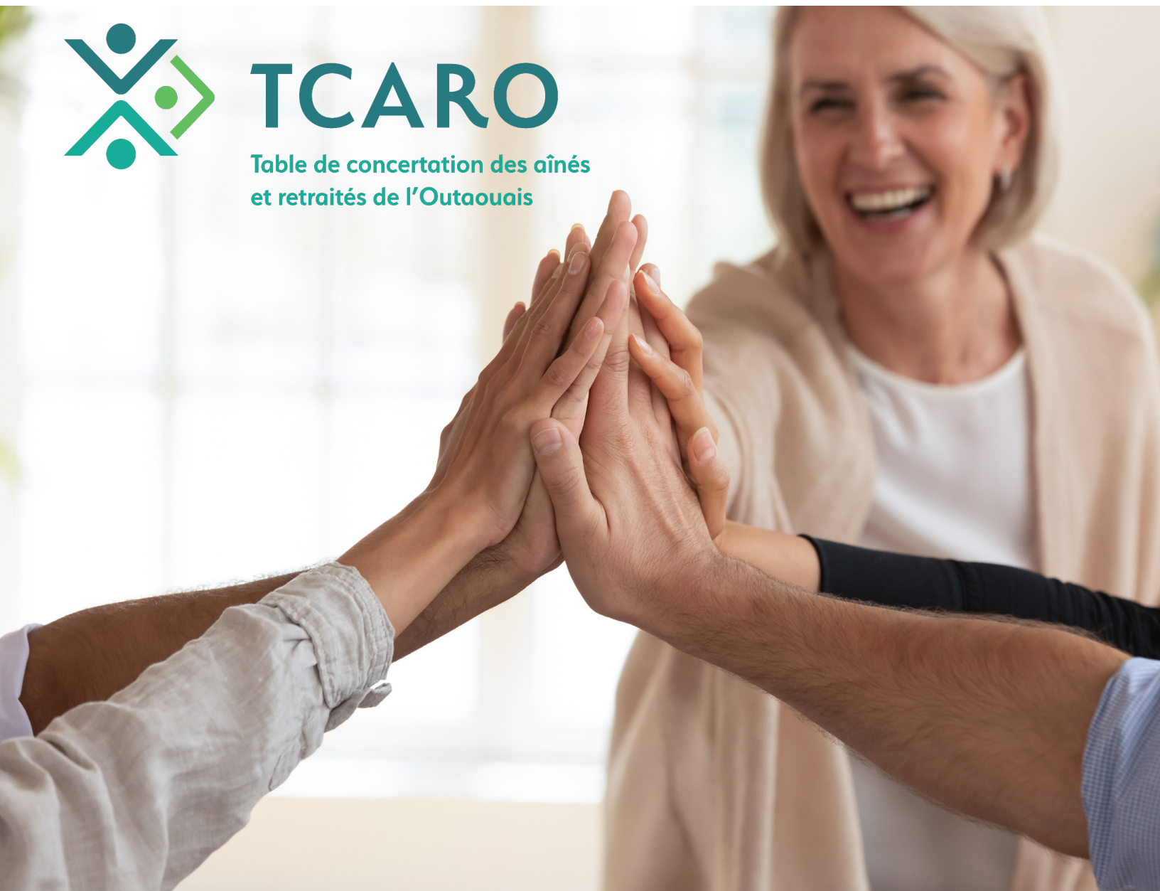
Table de concertation des aînés et retraités de l'Outaouais